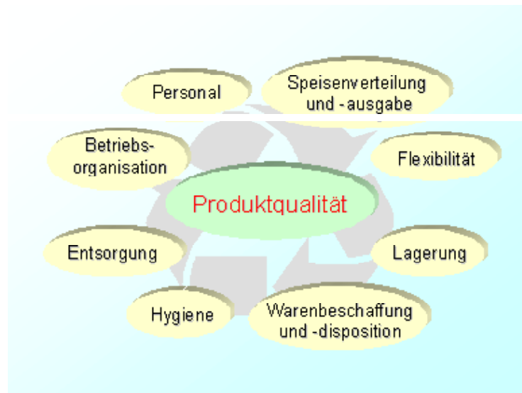
Abb.2: Einflussfaktoren auf die Produktqualität

Doch ist die Produktion über das Cook & Chill-Verfahren und damit die Qualität seiner Endprodukte sind einer Vielzahl von Einflussfaktoren ausgesetzt (s. Abb. 2).